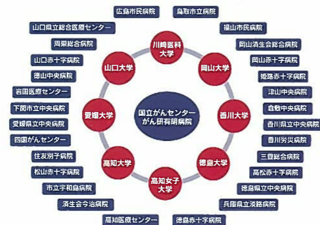
中国・四国全域に広がる拠点病院 組織的・効率的ながん治療の均てん化の実行組織 ■:コンソーシアム参加がん診療連携拠点病院