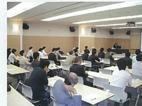
徳島大学病院西病棟日亜メディカルホールで開催した放射線腫瘍学セミナー

本セミナーを通じて、日本の放射線治療の抱える多くの問題点を再認識した。決して簡単に対処できる内容ではないが、今後の日常業務の中で力を注ぐべきポイントに関してヒントをいただいたセミナーであったと感じている。