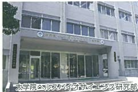
大学院ヘルスバイオサイエンス研究部