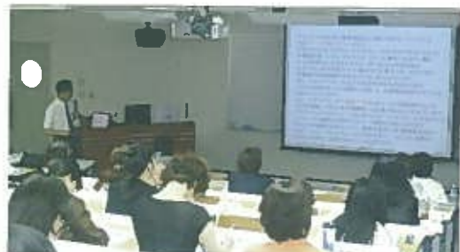
大学院のオープンカレッジ「がんと栄養」 平成20年7月26日、27日徳島大学キャンパスにて全国から約60名が出席

ここでは、がん栄養に関する、基礎から、臨床、実際の管理などを中心とした授業を行うこととなります。幅広く、深い知識および技術の習得が可能であり、チーム医療の一員として、医師などの他の医療スタッフと対等に話しあえる実をつけることをめざしています。