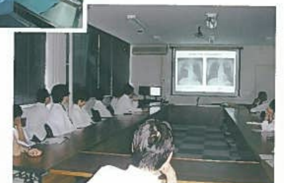
がんセンター合同会議