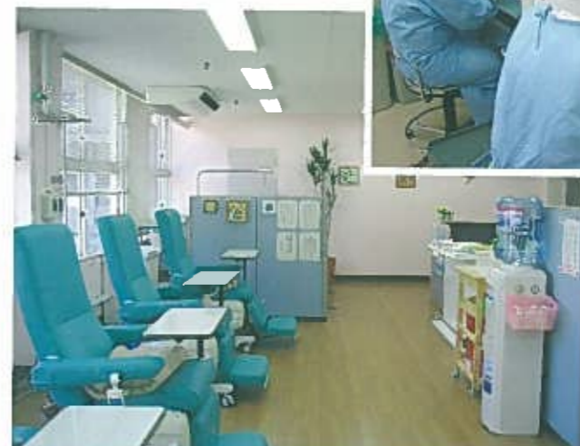
外来がん化学療法室