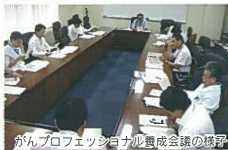
がんプロフェッショナル養成会議の様子