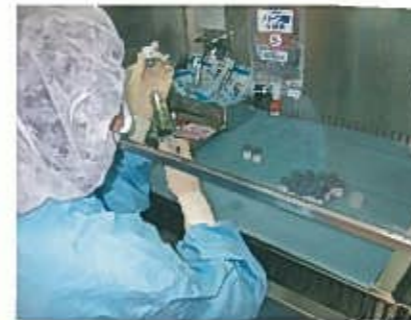
抗癌剤調製の様子

将来、中国・四国地方から1人でも多くのがん専門薬剤師がこのコースから生まれるよう、諸先生方のご協力をよろしくお願い申し上げます。