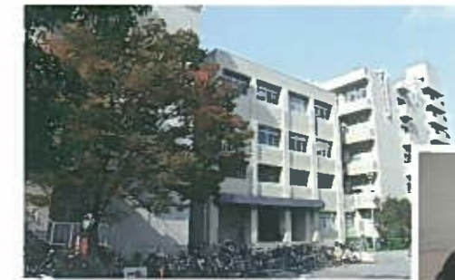
保健科学教育部のある校舎