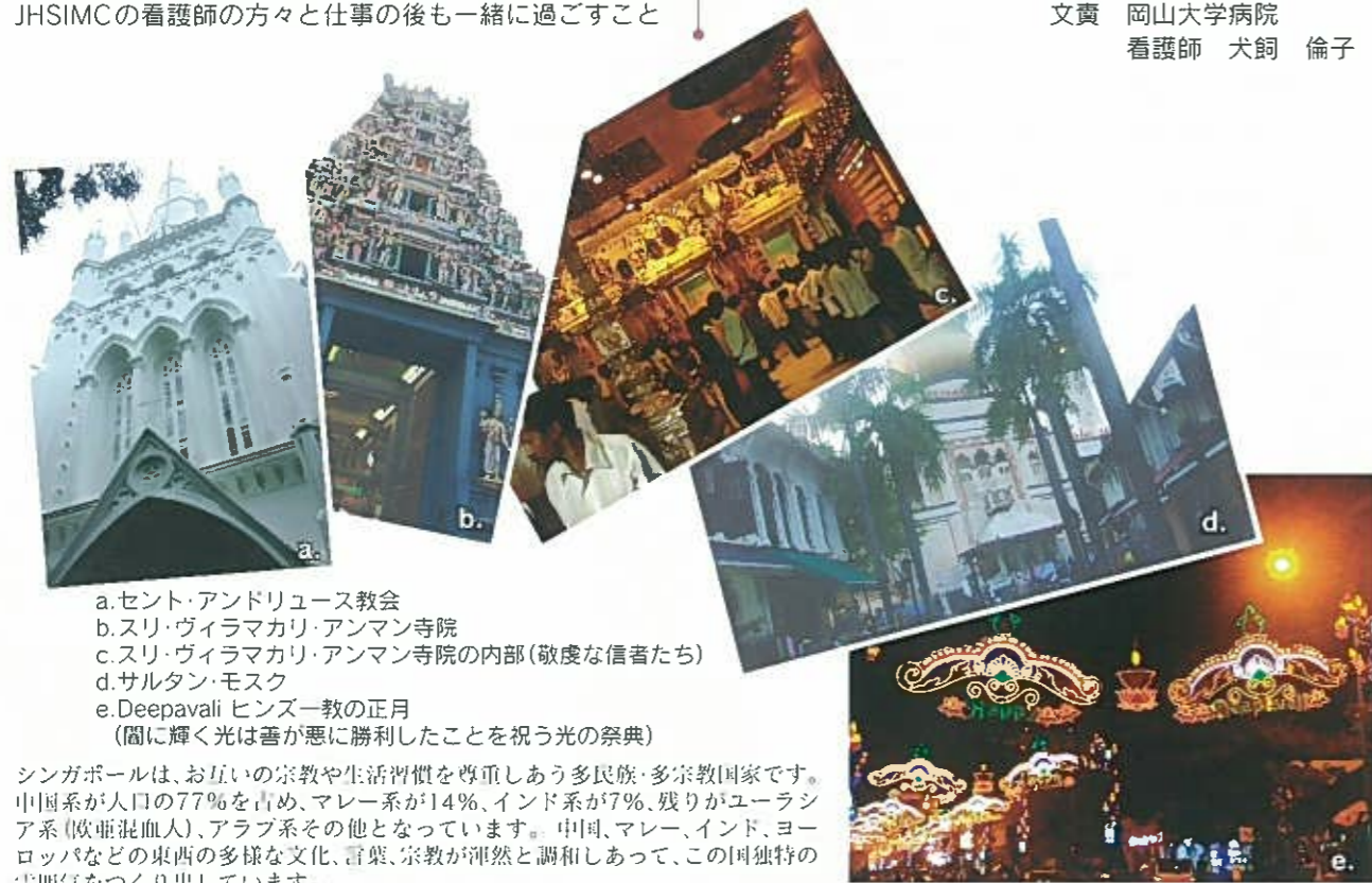
a. セント・アンドリュース教会 b. スリ・ヴィラマカリ・アンマン寺院 c. スリ・ヴィラマカリ・アンマン寺院の内部 (敬虔な信者たち) d. サルタン・モスク e. Deepavali ヒンズー教の正月 (闇に輝く光は善が悪に勝利したことを祝う光の祭典)

シンガポールは、お互いの宗教や生活習慣を尊重しあう多民族・多宗教国家です。中国系が人口の77%を占め、マレー系が14%、インド系が7%、残りがユーラシア系(欧亜混血人)、アラブ系その他となっています。中国、マレー、インド、ヨーロッパなどの東西の多様な文化、言葉、宗教が渾然と調和しあって、この国独特の雰囲気をつくり出しています。