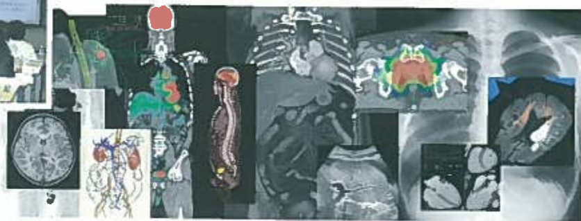
放射線医学領域の各種画像診断モダリティ画像と放射線治療計画画像