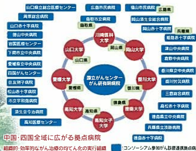
中国・四国全域に広がる拠点病院 組織的・効率的ながん治療の均てん化の実行組織 コンソーシアム参加がん診療連携拠点病院