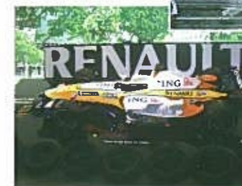
F1 in Singaporeが 帰国日に開催