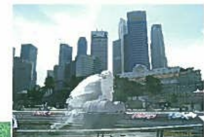
シンガポールの象徴 マーライオン

JHSIMCの教育プログラムは月毎の役割分担があり、時間単位で組み立てられているので、非常に効率的であると感じました。特に、外来診察の時は、診察後に計画を立てて、毎回毎回コンサルタントに今後の治療方針について相談し、議論を重ね、アドバイスをもらって問題点を解決していく姿は印象的でした。これは日本のある期間に目標を達成できたかどうかだけを判定基準にするのと大きく異なり、プロセスを重視していると感じました。毎回コンサルタントと議論を重ねることによってタフな理論構築がなされていくものと考えられました。帰国日にF1開催と重なり、道路封鎖や交通渋滞とちょっとしたハプニングもありましたが、今回の研修は、効率よく見学プログラムを組んでいただいていたため、イギリス方式の教育システムに沿ったJHSIMC流の若手医師育成プログラムを短期間に効率よく見学でき、非常に有意義でした。