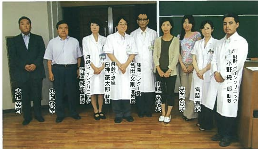
緩和医療専門医養成コース大学院生と教官 2008年9月10日、大学院講義終了後に講義室で

平成20年度、香川大学大学院医学系研究科では、緩和医療の専門医を取得し、中国四国地区の緩和医療を担う人材を育成する中国・四国広域がんプロフェッショナル養成コンソーシアムの緩和医療専門医養成コースに5名の医師が入学しました。各先生方の自己紹介と大学院での抱負を述べてもらいました。