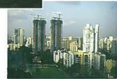
private病棟から見たシンガポールの町